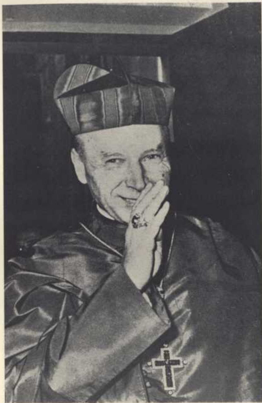
Stefan Karol Wyszyński

Prymas Polski Ksiądz Kardynał Stefan Wyszyński obchodzi w bieżącym roku podwójny jubileusz: trzydziestolecia pracy naukowej oraz dziesięciolecia rządów prymasowskich w prastarej stolicy duchowej Polski — Gnieźnie i współczesnej — Warszawie.